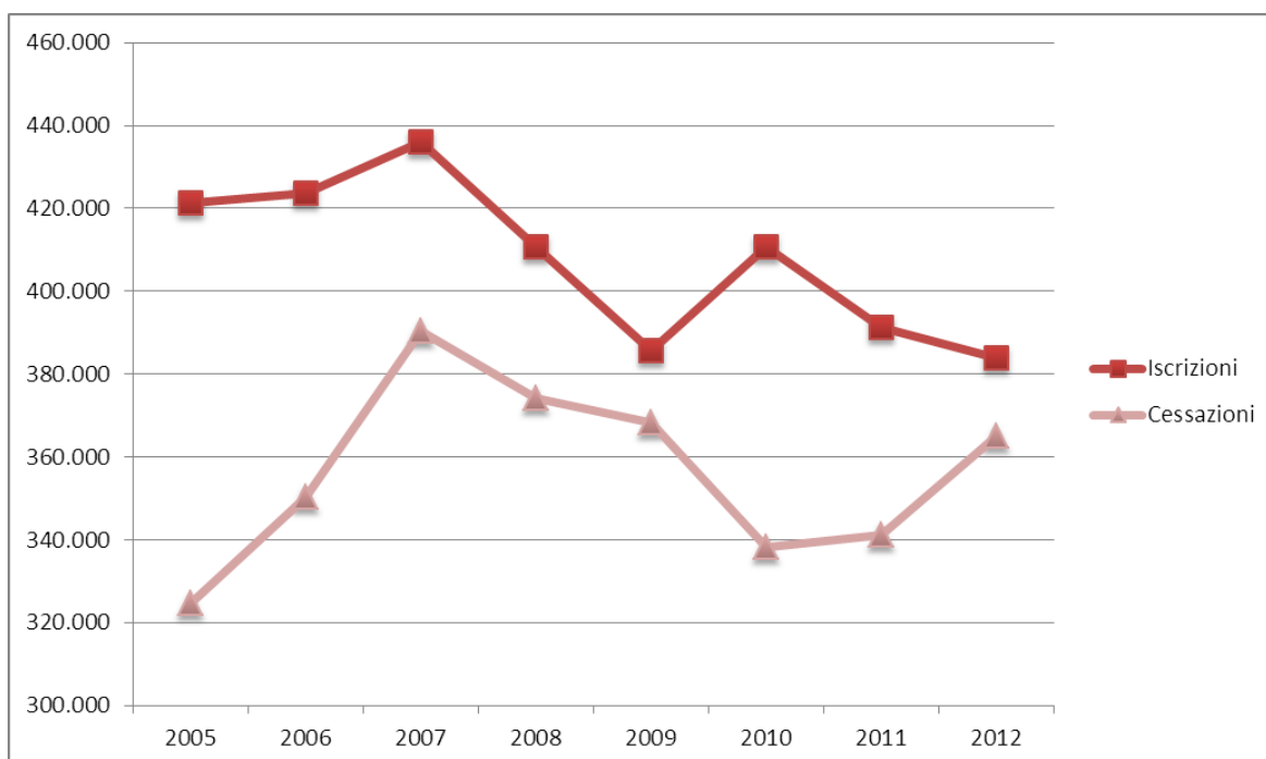
Graf. 1 - Iscrizioni e cessazioni al Registro delle imprese – Anni 2005-2012 Totale imprese

Fonte: Unioncamere-InfoCamere, Movimprese